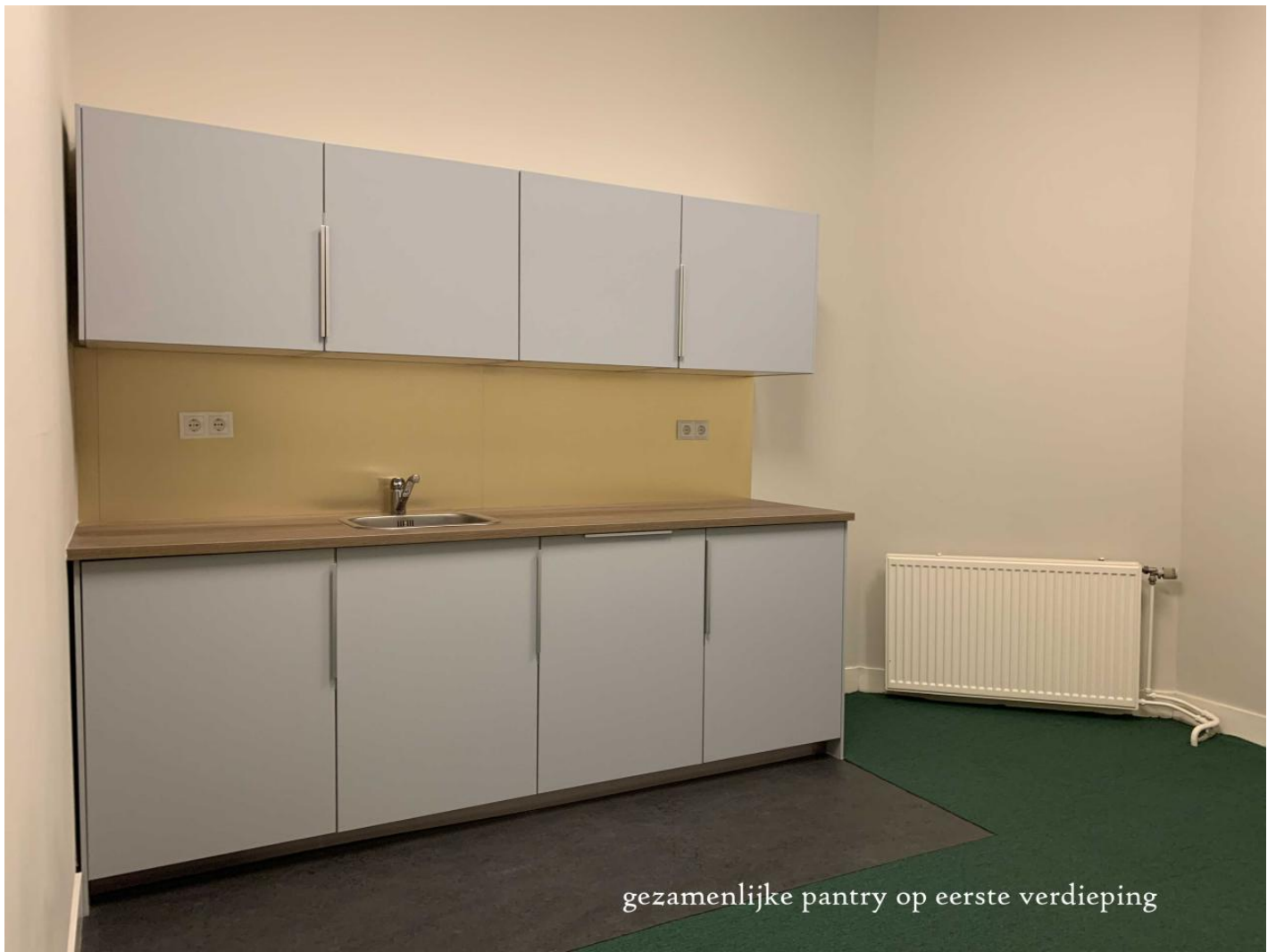
gezamenlijke pantry op eerste verdieping