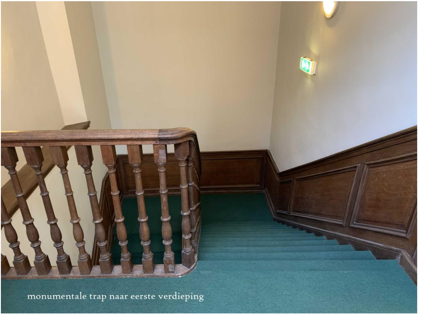
monumentale trap naar eerste verdieping